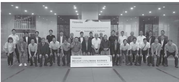
Bコース 東芝エネルギーシステムズ(株) 京浜事業所

実態、労働安全衛生の取り組み方について視察し各地域協議会の運動強化に繋げることを目的とし、一般的な観光施設はできるだけ入れず、横浜地域連合でなければ訪れることができない特別な場所を視察していただく、を基本方針とした。五役を中心に呼びか