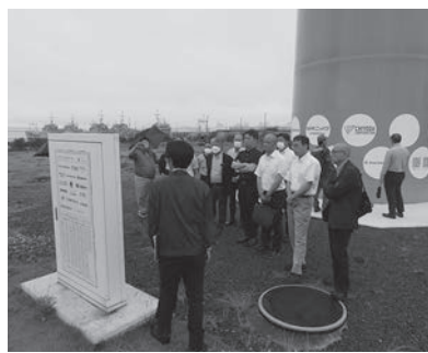
Bコース ハマウイング