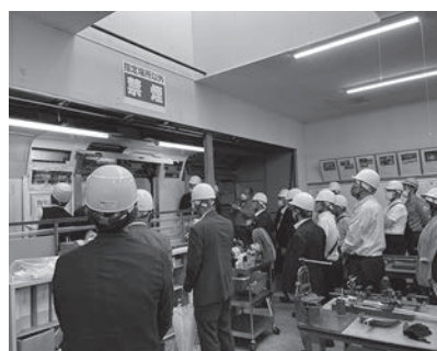
Cコース (株)総合車両製作所

た施設もあったが、臨機応変にご対応いただき、無事終了することができた。昼食はすべて重慶飯店を利用し、横浜中華街の味を楽しんでいただいた。