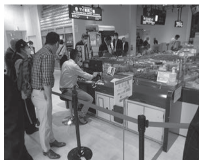
Aコース 京急ミュージアム

2日目の市内視察では3コースに分かれて構成組織の会社や工場を視察していただいた。コース作成にあたっては、政令市における勤労者の職