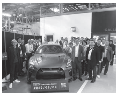
Cコース 日産自動車(株) 横浜工場