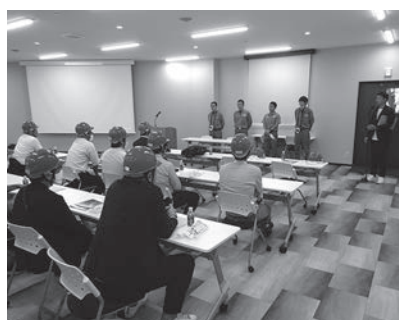
Aコース 日本飛行機(株) 横浜工場