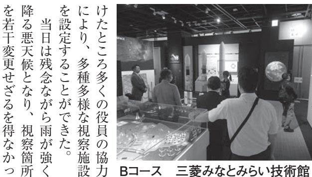
Bコース 三菱みなとみらい技術館