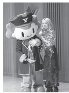
Eyes'さんとコルスくん

2日目の市内視察では3コースに分かれて構成組織の会社や工場を視察していただいた。コース作成にあたっては、政令市における勤労者の職