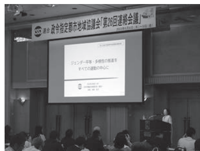
芳野会長 基調講演