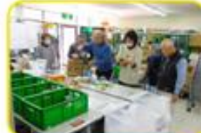
食品の仕分け作業のボランティア