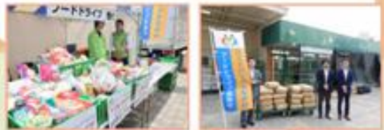
メーデー会場や労働団体などからたくさんの食品が集まりました