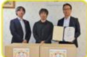
母子生活支援施設へタオルを寄贈