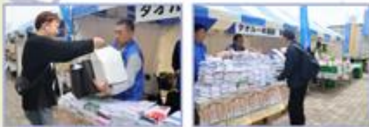
メーデー会場ではたくさんのタオルが集まりました