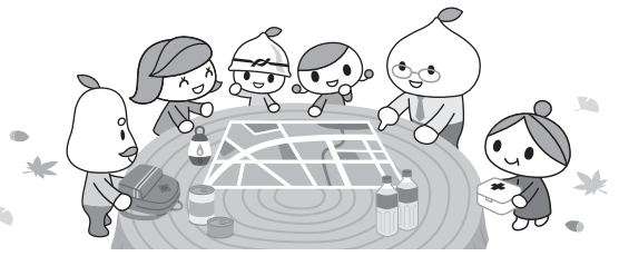
公式キャラクターピットくん・ピットくんファミリー