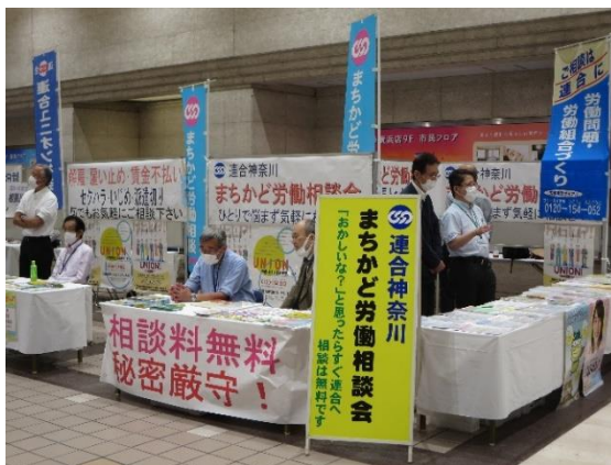
第1回「ましかど労働相談」2022年5月14日(土)