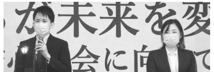
議長団 増田代議員(左) 赤池代議員(右)