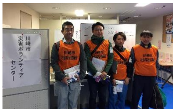
連合神奈川、電機連合、自治労の皆さん

災害ボランティア活動が本日からスタート! 休日は個人ボランティア優先、平日は団体ボランティア対応です。本日のボランティアは4名。浸水被害が大きかった中原区上丸子山王町一帯を訪問し、ボランティアが必要か否か、消毒を終えたか否かなど、1軒1軒のお宅にチラシを持って巡回をしました。1ヶ月が経過しましたが、未だに災害ゴミや被害の爪痕が残っていました。