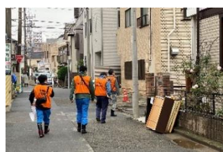
チラシを持って巡回中