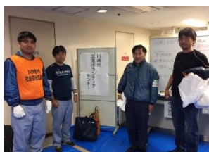
基幹労連、電機連合、自治労の皆さん