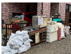
処分待ちの災害ゴミ