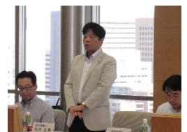
挨拶をする柏木会長