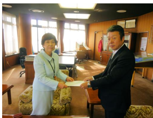
二宮町村田町長へ提出

本年3月以来、各単組よりの意見と、地域連合推薦議員と意見交換をして作成した2018年度の政策・制度要求を来年度予算への反映を求めて11月1日平塚市、11月2日秦野市と大磯町に提出。11月8日には伊勢原市、11月13日二宮町に提出しました。