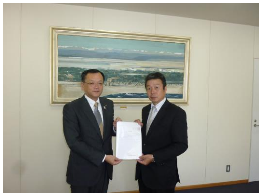
平塚市落合市長へ提出