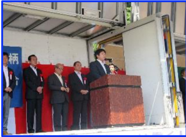
下川実行委員長挨拶