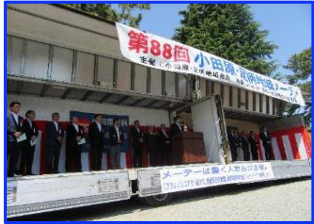
ステージ壇上の来賓の方々