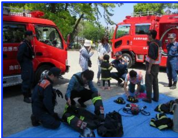
小田原消防イベント風景