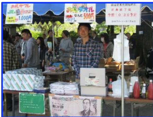
労組の模擬店風景