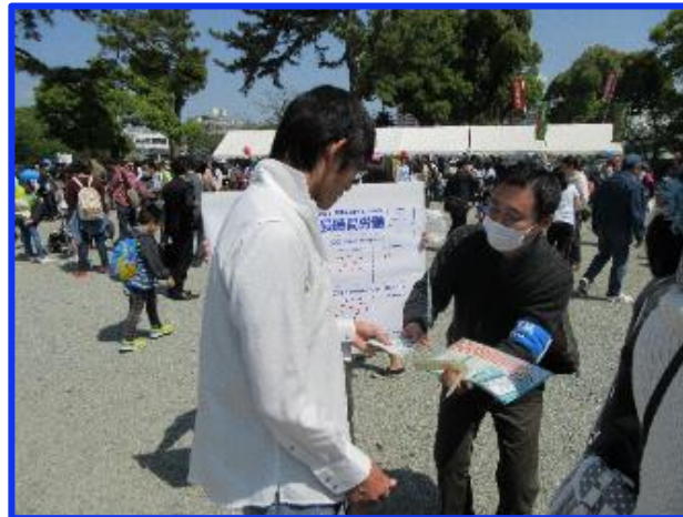
クラシノソコアゲ街頭アンケート