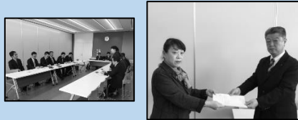
幸区長(左)から回答書を受取る小山議長(右)

2017年2月17日(金)、幸区役所において幸区に提出しました「要請書」に対する回答会議が開催されました。要請項目:道路交通(8)、生活環境(2)、教育文化(2)