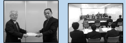
川崎区長(左)から回答書を受取る野中議長(右)

2017年1月24日(火)、川崎区役所において「2017年度に向けた政策制度要求」の回答会議が開催されました。要請項目:道路交通(27)、生活環境(7)、福祉・医療(3)、都市基盤整備(7)、その他(3)