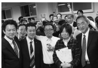
2連覇を果たした 不二サッシユニオンチームと仲間たち

2月9日(木)、川崎グラウンドボウルにおいて、地域の連携強化と親睦を深めることを目的とした、恒例の「地区交流ボウリング大会」を2階のすべてのレーンを貸し切り開催しました。