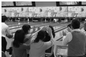
隣のレーンとみんなまで ハイタッチ!!

2月9日(木)、川崎グラウンドボウルにおいて、地域の連携強化と親睦を深めることを目的とした、恒例の「地区交流ボウリング大会」を2階のすべてのレーンを貸し切り開催しました。