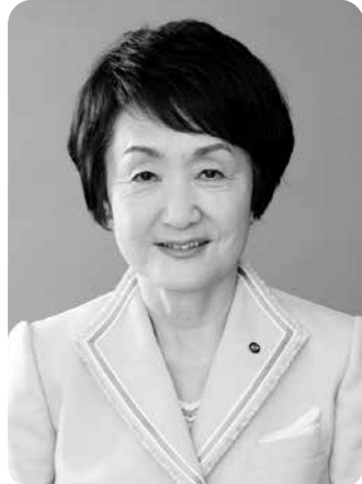
横浜市長 林 文子

横浜環状北線、南本牧ふ頭連絡臨港道路が開通します。災害時に重要な役割を果たし、経済成長にも寄与する都市基盤整備を着実に推進します。