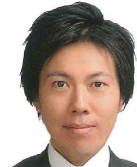
神奈川県議会議員 (高津区選出) さいとう たかみ