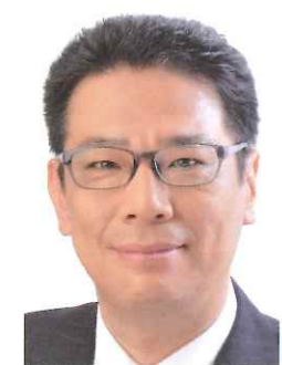
神奈川県議会議員 (宮前区選出) やなせ 吉助