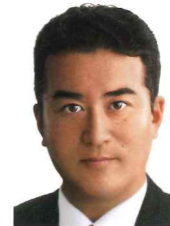
神奈川県議会議員 (中原区選出) たきた 孝徳