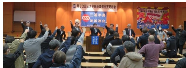
最後は参加者全員で団結ガンバロー!