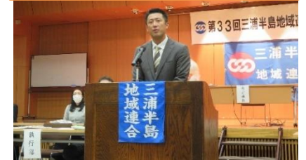
山梨崇仁葉山町長決意表明