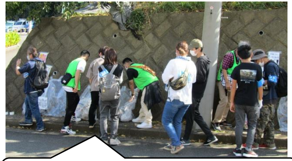
吉田市長からは「今日の活動を通して、みなさんの街の環境にも目を向けてほしい。」等の挨拶がありました。