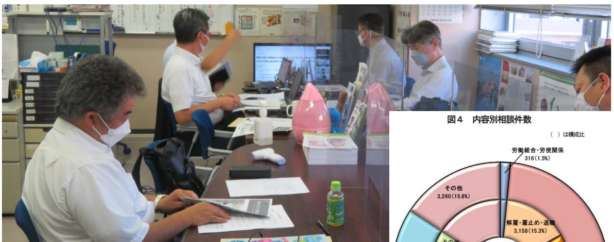
図4 内容別相談件数