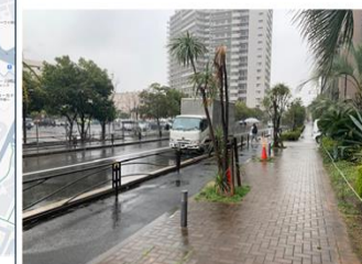
カワサキアイランドスイート居住者、横断歩道のない箇所を横断する様子。