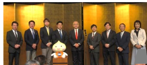
川崎市議会議員団