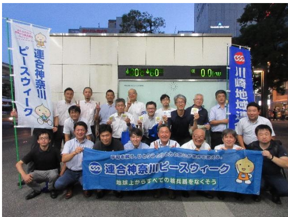
川崎駅 川崎中央・田島・大師地区

また、この取り組みに後援している川崎市は「核兵器廃絶平和都市宣言」をおこなっていることから、「核兵器のない世界の実現」と「安全で活力のある都市の実現」に向けた平和事業を推進するとして市長メッセージを読み上げました。