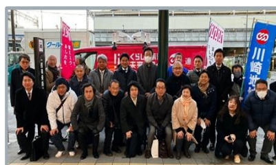
武蔵溝ノ口駅南口

2月22日(火) 17時半から川崎駅東口周辺において、18時よりJR溝ノ口駅キラリデッキにおいて、「2023連合アクション川崎デ－」を実施しました。▼川崎地域連合役員ならびに地区動員、連合神奈川、議員関係者ら54名が集結して、春闘勝利に向けた駅頭行動を行いました。▼また、連合が全国を巡回させた「連合アクションラッピングカー」は市内を13時から巡回し、「賃上げ実現・くらしの支援あしたを変える連合緊急アクション」を訴えました。