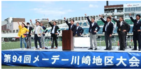
第94回メーデー川崎地区大会