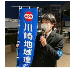
国民民主党 鈴木衆議院議員