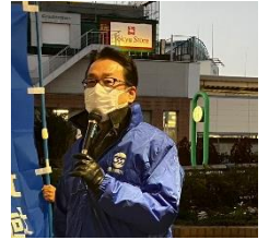
連合神奈川 林事務局長