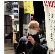
高津区 ほりぞえ健 自治労