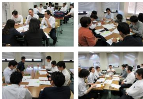
グループワークで情報共有