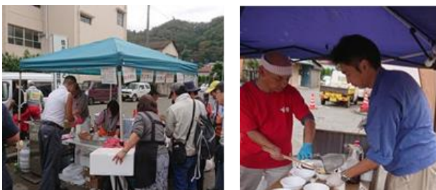
台風19号災害ボランティアの際の軽食提供の様子

「#相模原エール飯」の掲載飲食店の中には、昨年の台風19号災害ボランティアの際、作業員に無料で軽食を提供してくれた店舗も多くあることから、恩返しの意味も込めて取り組んでいます。