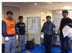
基幹労連、電機連合、全水道の皆さん