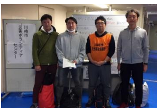
UAゼンセンの皆さん

2日目のボランティアは8名。2班に分かれて活動しました。多摩区堰地区のお宅で玄関まわりの清掃、高津区諏訪地区のお宅で庭の泥出し作業を行いました。