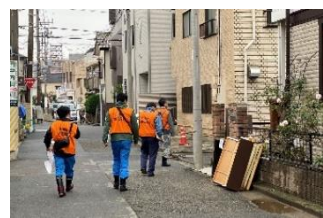
チラシを持って巡回中