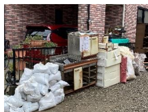
処分待ちの災害ゴミ