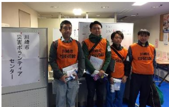
連合神奈川、電機連合、全水道の皆さん

災害ボランティア活動が本日からスタート！休日は個人ボランティア優先、平日は団体ボランティア対応です。本日のボランティアは4名。浸水被害が大きかった中原区上丸子山王町一帯を訪問し、ボランティアが必要か否か、消毒を終えたか否かなど、1軒1軒のお宅にチラシを持って巡回をしました。1ヶ月が経過しましたが、未だに災害ゴミや被害の爪痕が残っていました。