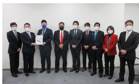
県議団から回答書を受領

2022年1月13日（木）川崎産業振興会館にて「2022年度に向けた神奈川県警に対する道路交通課題改善要望」（以降、交通政策という）に関する神奈川県警からの回答書は神奈川県議会議員団を通じて受領しました。