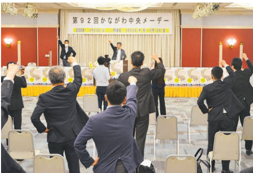
内容を簡略化した記念式典を関係者だけで開催した今年のメーデー

今年度の「かながわ中央メーデー」は、昨年に引き続き、従来のイベント形式ではなく、内容を簡略化した記念式典を関係者だけで開催すると