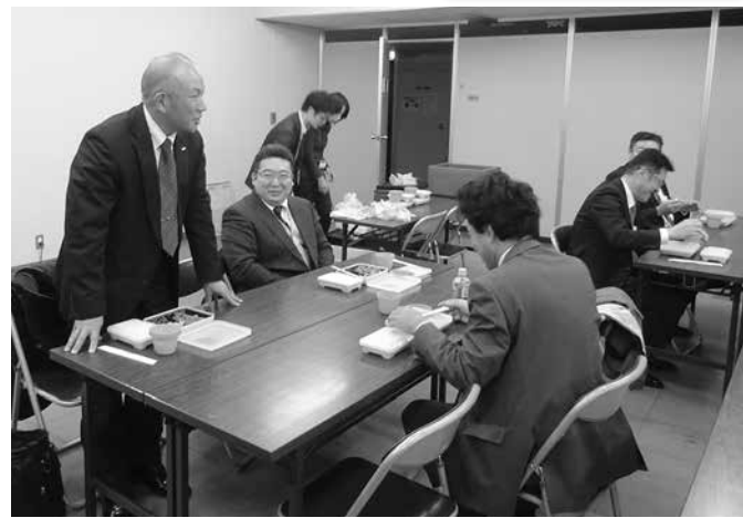
ハマ弁試食会の様子