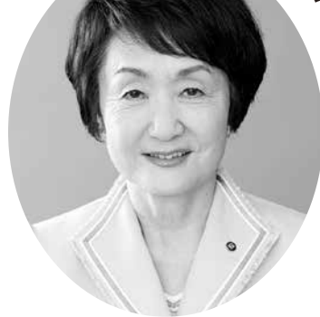
横浜市長 林 文子

ポスト2020に向けて、みなとみらい21地区ではパシフィコ横浜ノースやホテル、音楽ホールが次々にオープンし、賑わいと活力はさらに高まります。大型連休には日本初のクルーズ客船6隻同時着岸が実現、ナイトタイムエコノミーによる賑わいも創出していきます。3月に横浜環状北西線が開通し、交通ネットワークが充実します。2