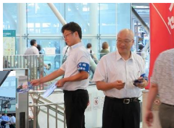
川崎駅前でチラシ配布