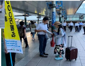
溝口駅前の署名活動