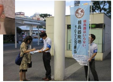
川崎駅前で署名活動