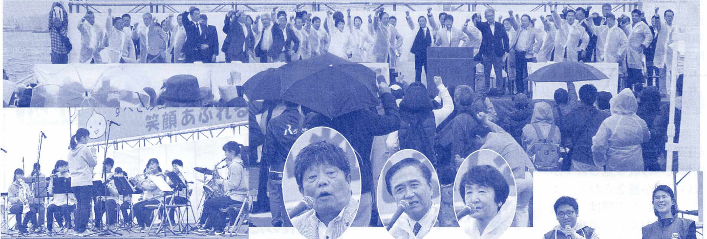
湘南高校吹奏楽部によるアトラクション