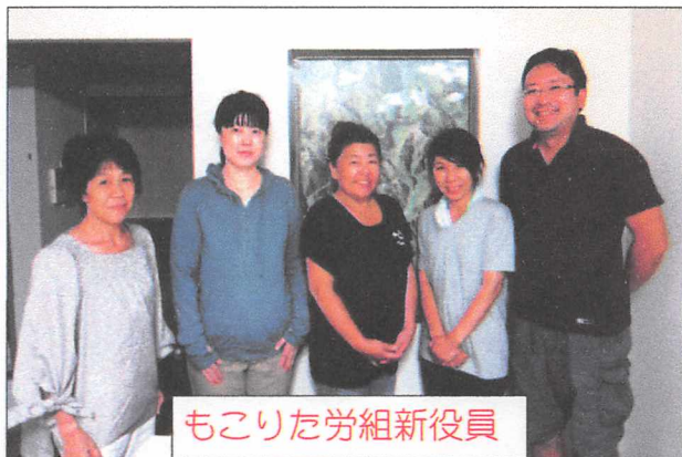
もこりた労組新役員