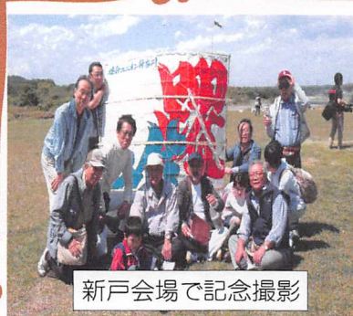
新戸会場で記念撮影

今年度はパワーアップします。体験プラス、詩や俳句そして各種評論などの文芸作品などなど募集中。組合員に愛される機関誌を創りましょう！