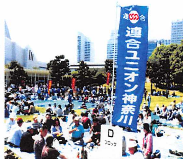
交流するユニオン組合員

雨の心配を間労働が当たり前の状況の中で米国の労働者が『8時間は仕事のために...』と訴え統一ストライキを行なったのが始まりです。①現在、『働き方改革』が国会で審議中です。労働基準法制定から71年たつて初めて『罰則付時間外労働の上限規制』が法制化されようとしています。今、個別労使による36協定の締結の持つ意味が今まで以上に重要になってきます。そのために労働組合が前面に立たなければなりません。まだ高度プロフェッショナル制度が残っています。『小さく産んで大きく育てる(年収基準を徐々に下げます)』を許すわけにはいきません。②春季生活闘争は、中小において大手追従・準拠からの脱却に取り組んでいます。賃上げの継続にこだわった結果連続して前進が見られません。③民主主義の劣化